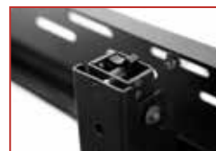
Feinjustage ohne Werkzeug

Integrierte Sicherungen der Kabelführungen vereinfachen die Verkabelung zwischen Displays