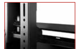
Verriegelung verhindert Entfernen des Displays